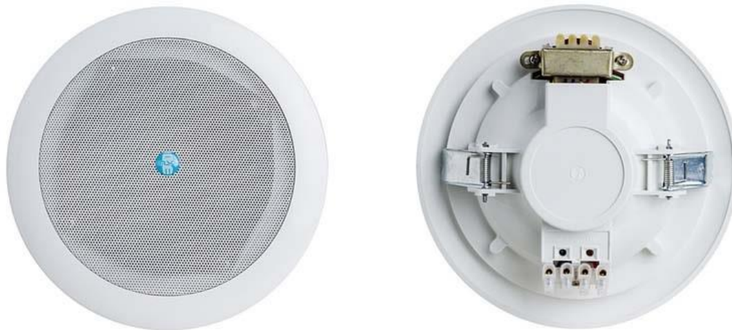
Рис. 1. Внешний вид громкоговорителя.

Внешний вид громкоговорителя показан на рис. 1.